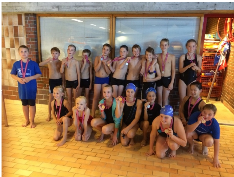
Rekrutt-stevne Karmøyhallen 21.9.14.

Fra rekruttene og opp til konkurransegruppa er det gått 6 svømmere i slutten av 2014. Disse er fra 2002-2005-modeller.