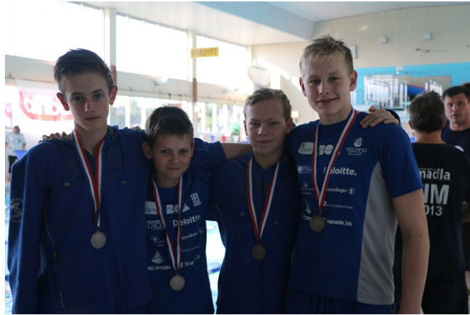
Stafettlaget under Araberswim 2014.