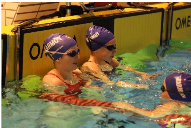
Innsømming på Haugaland Kraft Open januar 2014.

Utvalget består av oppmann, alle trenere og leder/nestleder. Det har vært avholdt 2 møter i 2014. Møtene har hatt fokus på treningstider, trenere og treningsopplegg for og best kunne tilrettelegge for alle svømmerne i begge hallene.