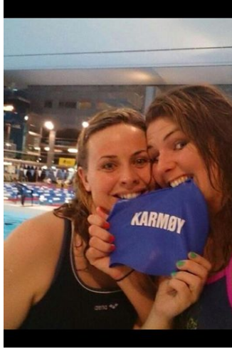
Masters-svømmere NM 2014.